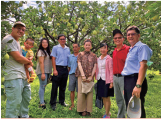
⑥邀請斗六農會及斗六地區青農，共同拍攝斗六文旦產業介紹影片