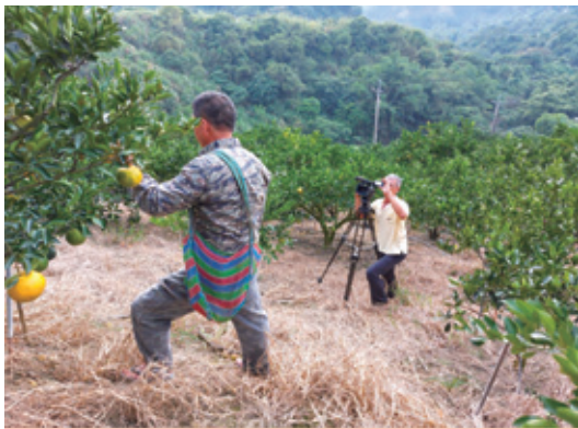
⑦於東山地區拍攝青皮椪柑產業介紹影片

與分級包裝】、【斗六的文旦】、【東山青皮椪柑】及【竹崎椪柑】等產業介紹影片，並上傳本場YouTube頻道，共計有194次瀏覽。拍攝研發成果【水稻鐵粉直播】及【水稻新品種臺南19號】影片並上傳本場YouTube頻道，共計有535次瀏覽。