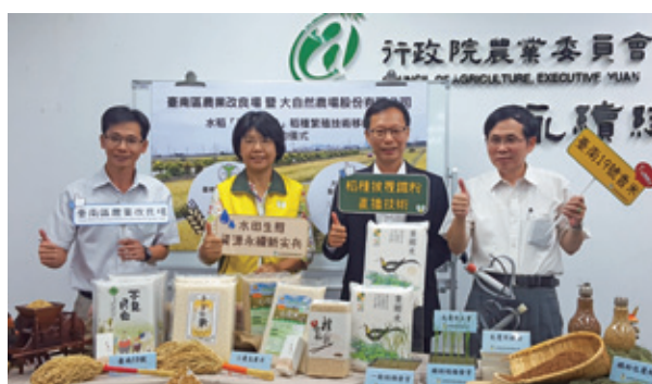
② 農委會記者會-水田生態、水資源永續新尖兵～稻種披覆鐵粉直播技術、水稻香米新品種‘臺南19號’

配合本場辦理之觀摩會、座談會、展覽及競賽，錄製拍攝活動影片及照片。配合產季，拍攝【麻豆文旦的產業