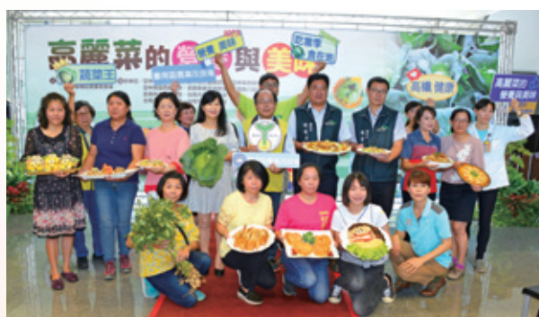
④ 「高麗菜的營養與美味」記者會