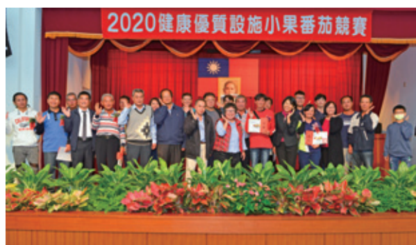
⑤ 「2020小果番茄達人出爐」記者會