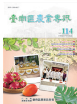
1 109年出版之農業推廣刊物