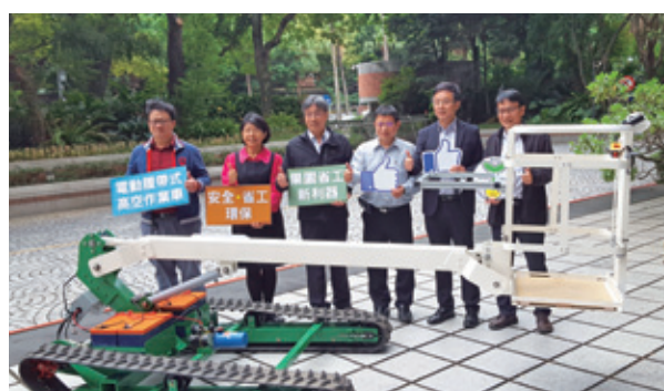
③ 農委會記者會-果園高空作業「安全、省工」新利器，電動履帶式高空作業車