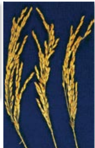
①台南秈15號植株、稻穀、稻穗