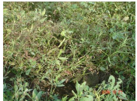
▲受斜紋夜盜蟲嚴重為害的落花生 (文/圖 陳昇寬)

產生抗藥性；(3) 利用性費洛蒙長期誘殺雄成蛾，以降低其田間密度。每公頃設5~10個點，放置高度應比作物生長點高30~60公分，每月更新誘餌一次。作物種植密集地區應採共同防治，成效更佳；(4) 注意清園之工作，間作之作物應同時施藥，徹底清除蟲源；(5) 旱田作物於種植前整地翻犁後浸水一天以上，可將土中之蛹或幼蟲淹死；(6) 收穫前注意化學藥劑的使用，或改用蘇力菌防治，注意安全採收期，以免造成農藥殘留過量之問題。