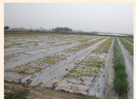
▲罹病毒田毫無收成