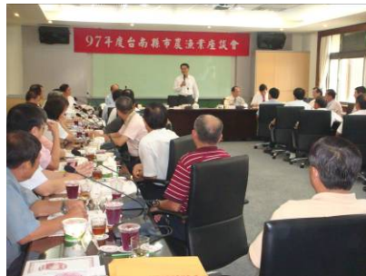
▲座談會現場發言踴躍