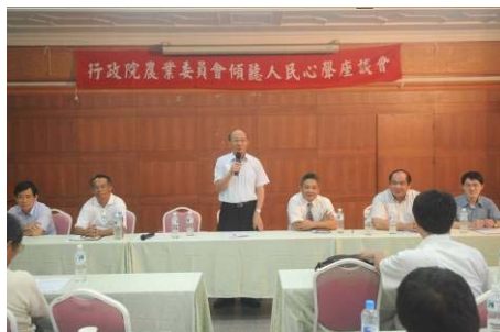
▲侯場長親臨主持座談會