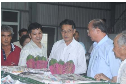
▲陳主委參觀木瓜運銷集貨作業

陳主委會後由本場侯場長及主管陪同，視察大內鄉木瓜產銷班，與產銷班班員交換意見，參觀木瓜集貨包裝廠，隨後轉往新化鎮農會食用甘藷產銷班參訪，對於產銷班開發多元加工食品、創立「瓜瓜園」品牌、成功提高傳統作物經濟價值，給予高度肯定。