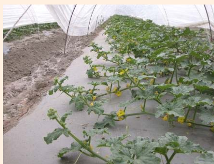
▲罹病毒植株翹尾生長停止