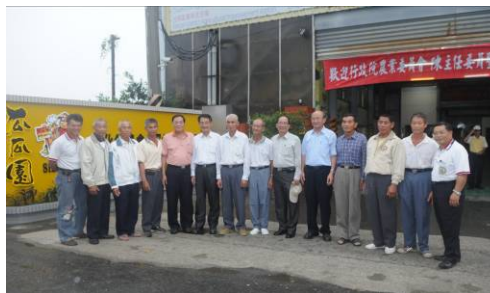
▲陳主委與新化甘藷產銷班班員合影