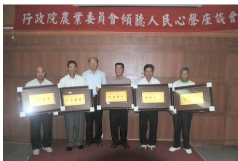
▲侯場長頒發獎牌給雲嘉南地區「2008十大經典好米」得獎的6位農友

賣專區、農田排水工程、農業設施抵押貸款、農產品外銷、綠肥病蟲害及種子、農藥及肥料補助等，由與會官員現場回答或帶回處理，充分與農民溝通。侯場長在台南縣場次並表揚及頒發獎牌給雲嘉南地區「2008十大經典好米」得獎的6位農友。