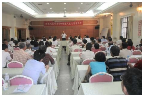
▲台南縣座談會現場