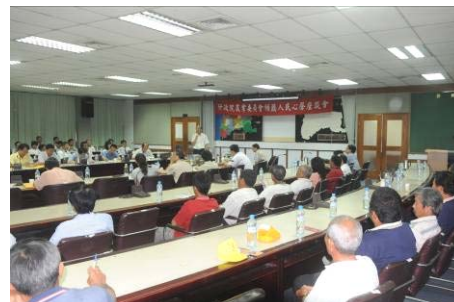
▲雲林縣座談會現場