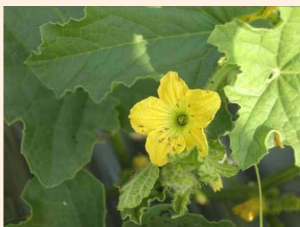
▲開花期薊馬密度高

因該病毒可藉由機械傳播，所以洋香瓜生育期間進行的摘心、整蔓作業常易造成病毒的快速蔓延，農友在進行必要的田間操作時，多注意植株狀況，發現疑似罹病毒株需先避過，當完成所有健康植株作業後，再回頭將病株拔除，且帶離園區，以避免機械傳播的機會。遵守合理化施肥可以強健洋香瓜植株，植株強健更能抵抗病毒的侵染，病毒病的預防需從整地、施肥開始。(文/圖 鄭安秀)