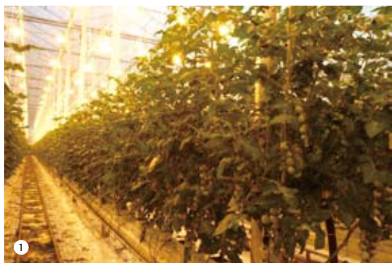
① 荷蘭冬季番茄生產，以高壓鈉燈為主要使用的人工光源進行補光

多樣化規模發展。至2010年荷蘭的溫室面積已達10,311公頃，並以生產蔬菜及花卉為主，蔬菜生產面積占了5,041公頃，主要以番茄、甜椒及小胡瓜為大宗（荷蘭國家統計網）；有超過50%的蔬菜溫室面積集中在Westland區域，約有80%的溫室生產蔬菜進入外銷市場。