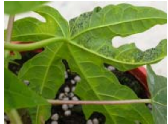
木瓜黑腐病造成葉背水浸狀病斑