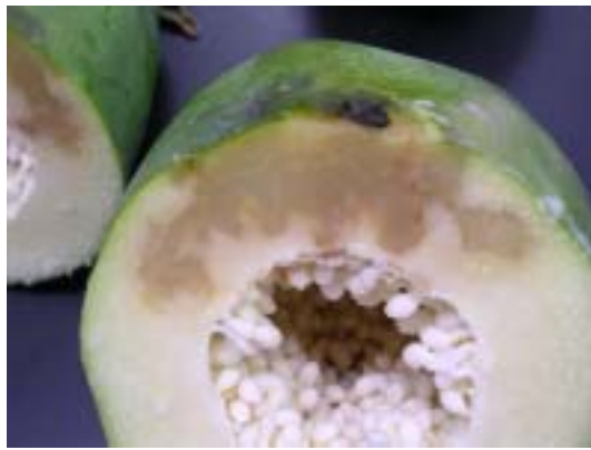
木瓜黑腐病危害果實