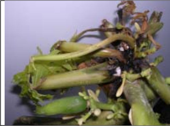
木瓜黑腐病引起之株心黑腐病徵