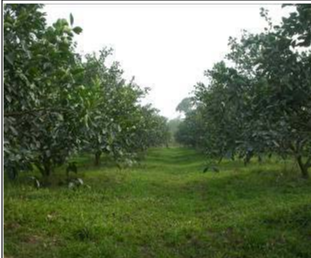
明尼桔柚栽培行株距不宜過密，以增加光照 及田間操作