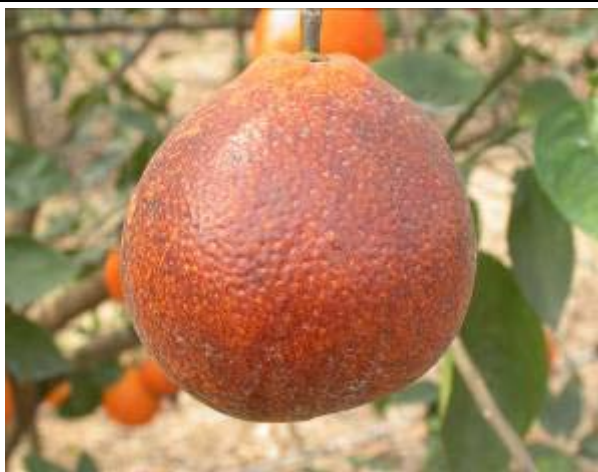
果實受銹蟎之危害狀