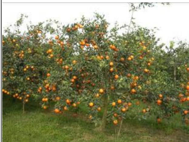
結實纍纍之明尼桔柚植株