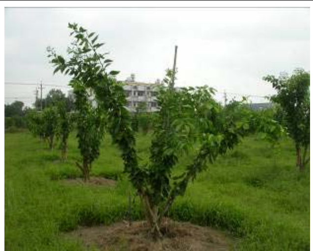
明尼桔柚幼年樹的整枝修剪，主要在於培養樹 形，並分年養成擴大樹冠