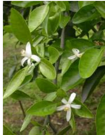
明尼桔柚開花情形