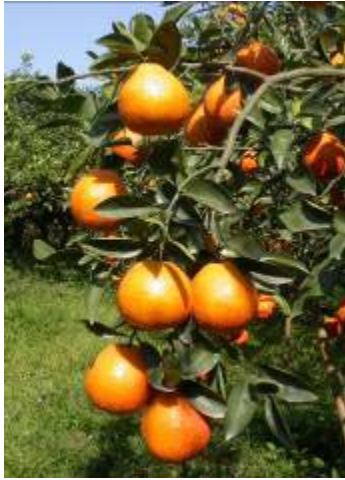
明尼桔柚由於果型佳、色澤鮮豔、風味濃郁， 廣受消費者喜愛。