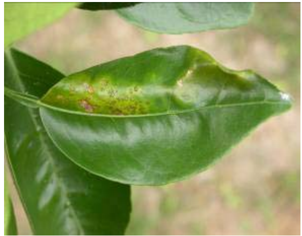
葉片受潛葉蛾危害處易發生潰瘍病