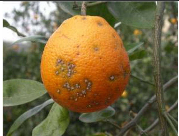
風大、多雨處易感染潰瘍病，影響果實外觀