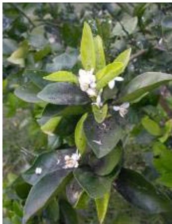
花期受蚜蟲危害後，誘發煤病之情形