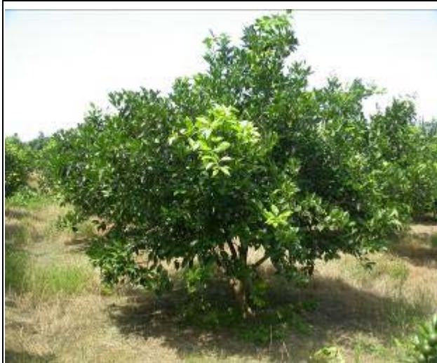
明尼桔柚成年樹的樹形管理，以維持樹形並增加光照與通風