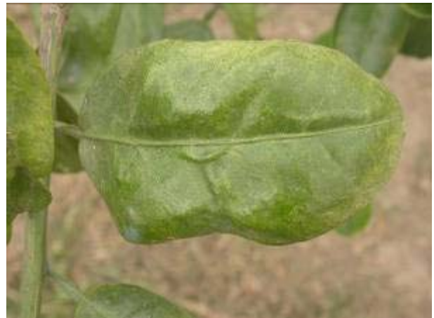
葉蟎危害葉片之情形