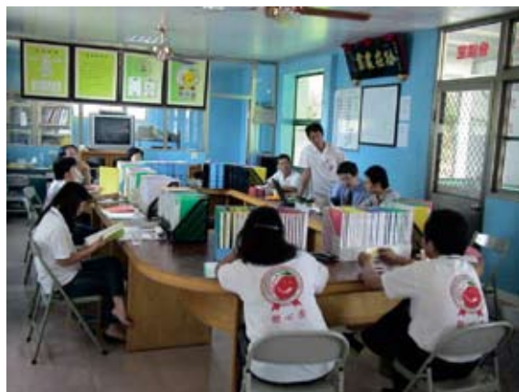
▲ 申請EUREPGAP驗證情形