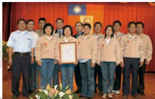
▲ 95年十大經典農業產銷班—南化鄉果樹產銷班第20班