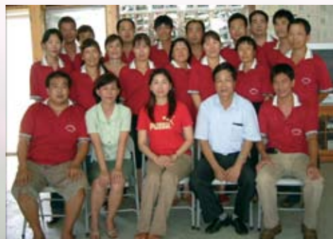
▲ 95年十大經典農業產銷班—太保市蔬菜產銷班第13班