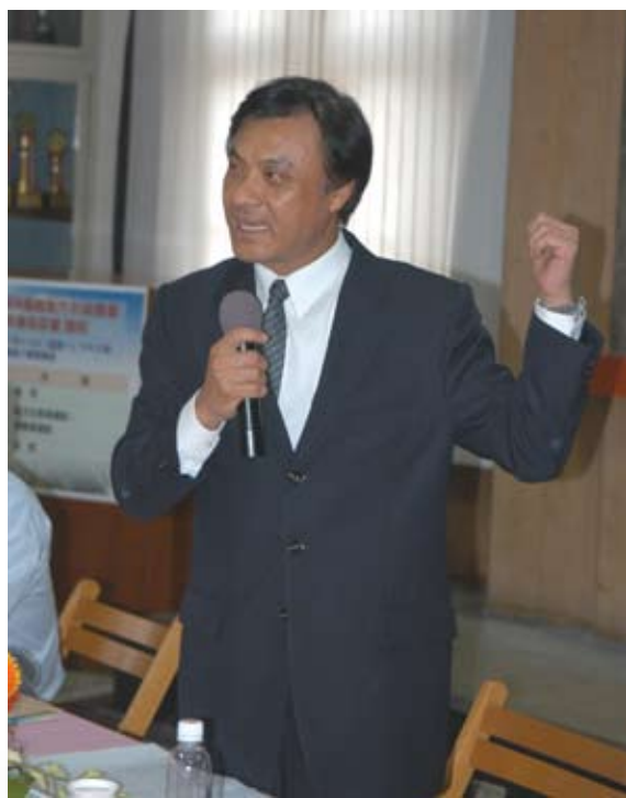
▲ 蘇主委強調農委會推動「新農業運動」的決心

農委會蘇主委1月下旬就任以來，一再強調農業不是弱勢產業，台灣農產品品質若能提升並走向國際化，台灣農業沒有「悲觀」二字，因此構思提振台灣農業活力與競爭力，「新農業運動—台灣農業亮起來」是他首次提出具體的農業施政願景與策略。蘇主委表示「新農業運動」啟動後，農業施政的視野將會擴大，農業施政六大面向是從研發到行