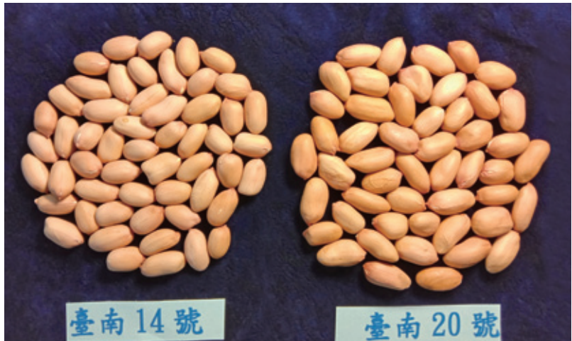
圖二、國內第一個透過分子標誌輔助選種技術所育成的落花生品種‘臺南20號’。落花生臺南20號是透過分子標誌輔助選種策略選育具高油酸與亞油酸(O/L)比值落花生品種，此品種可大幅降低氧化速率，提高儲架壽命

2007年開始，國內大專院校與農業試驗單位已逐漸透過分子標誌輔助選種技術用於選育新的作物品種，目前國內已有許多作物(水稻、番茄、落花生、番椒、花椰菜、甘藍與青花菜)在育種上使用此技術進行品種的改良工作。其中又以水稻、落花生與番茄的抗病育種應用最為廣泛。目前為止，國內農業試驗研究機構已透過分子標誌輔助選種技術育成了5個作物新品種，品種資料如表一。分子標誌輔助選種技術已是目前國內外進行作物品種改良不可或缺的新技術，也是產業應用進展的最前端。